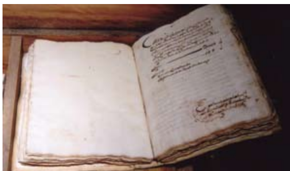
Libro infestado por Stegobium paniceum .

Se detectaron entre otros a Stegobium paniceum , que estaba colonizando los cereales expuestos en un auténtico granero que se exhibía en el interior de la fortaleza. También había empezado a atacar un valioso libro de aquella época y se procedió a su tratamiento y protección, dado su indudable valor histórico. El método a seguir fue la sustitución regular del cereal invadido, no dejando que el insecto completase su ciclo biológico. El control del adulto consistió en la discreta instalación de su feromona de atracción en varias trampas. También se colocaron regularmente trampas con la feromona sexual para Plodia interpunctella , que también se había sumado a la fiesta.