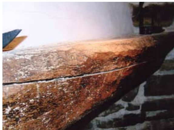
Madera con carcoma.

Mención a parte tendría el tratamiento de la madera expuesta para combatir esta vez a otro anóbido, en este caso xilófago empedernido como es Anobium punctatum , que no dudó en colonizar lanzas, vigas, carros, sillas, etc.