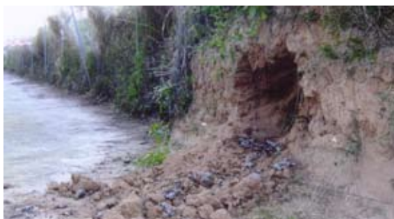
Ubicación de uno de los nidos.