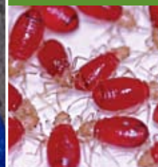
26 - los chinches de la cama