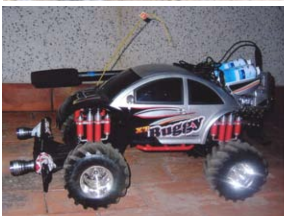
Vehículo todo terreno teledirigido con cargas insecticidas.