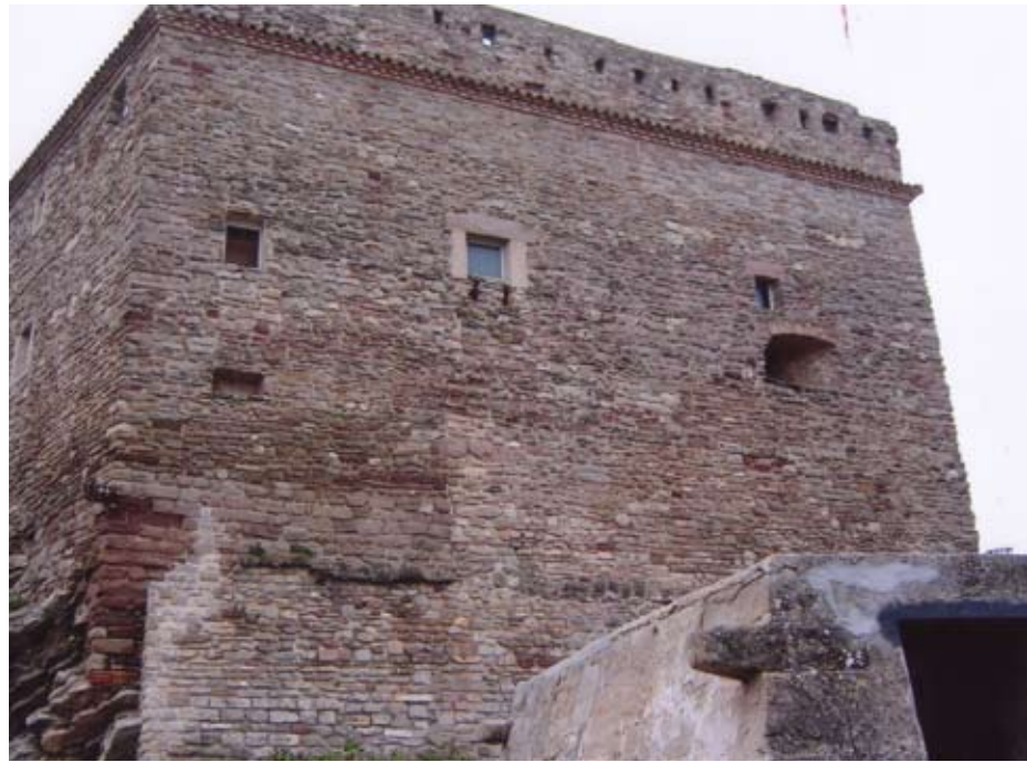
Castillo de Súria, Barcelona.