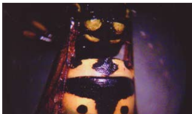
Detalle de un adulto de Vespula germanica .

Esta avispa puede picar repetidamente debido a que su aguijón es liso, no como la abeja que su aguijón es como un arpón y se le desgarran las vísceras cuando pica a un mamífero. Los aguijones son ovoposidores modificados, ya que en un principio cumplía la función de ovopositor, pero al pasar a ser organismos sociales en los que se reproduce la reina y las obreras son estériles, éstas transformaron su entonces inútil ovopositor en un arma con veneno. Es una especie que se caracteriza por la peculiaridad de que además pueden morder. Los machos carecen de aguijón. Cuando un ejemplar pica libera una feromona de alarma que incita a las demás a hacer lo mismo persiguiendo a los intrusos. Se ha descrito la feromona como (Z)-2-metil-1,6-dioxa-espiro (4-5) decano, compuesto espirocíclico, para Vespula vulgaris que es una especie muy parecida a Vespula germanica . Cuando una persona se aproxima a estos enjambres, debe tener en cuenta el no llevar perfumes ni vestuario de colores llamativos. También atacan las heridas abiertas.