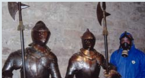
18 - Prevención de plagas en castillos medievales