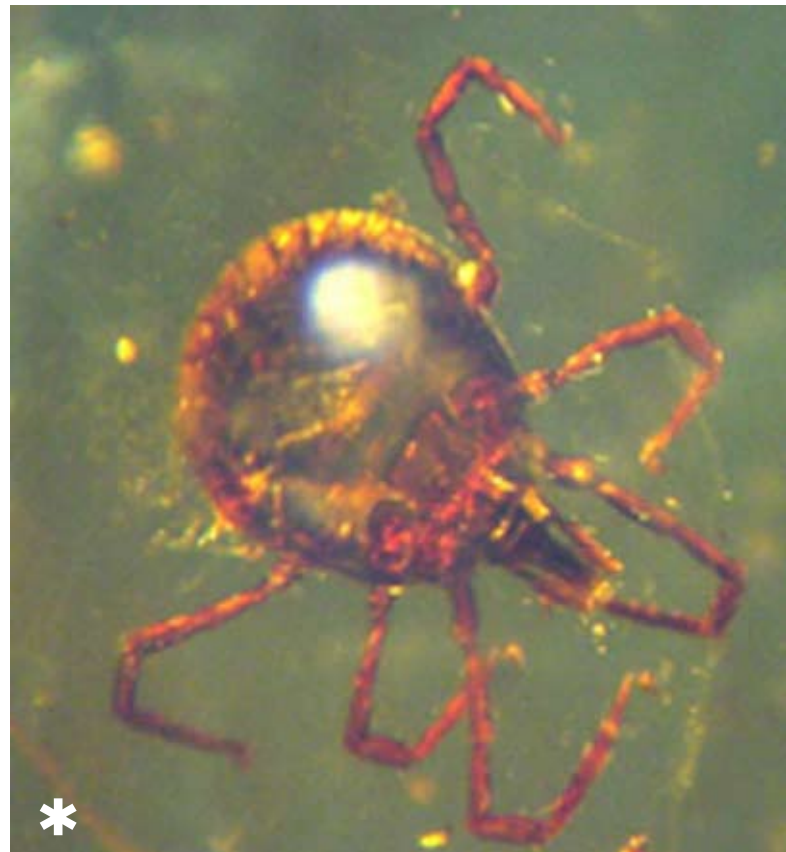
Garrapata en ámbar de Birmania.

Noticias y comunicaciones de la Universidad Estatal de Oregón, Corvallis, Oregón.