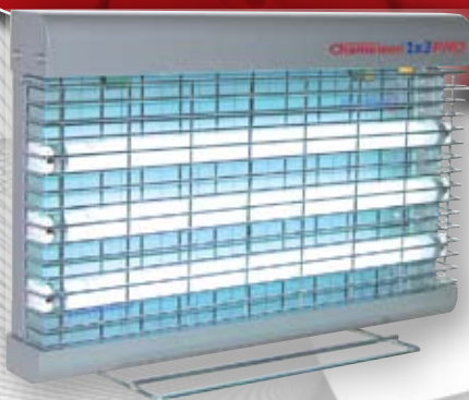
Chameleon® 1x3 PRO

Diseños innovadores para un control de los insectos voladores discreto y efectivo