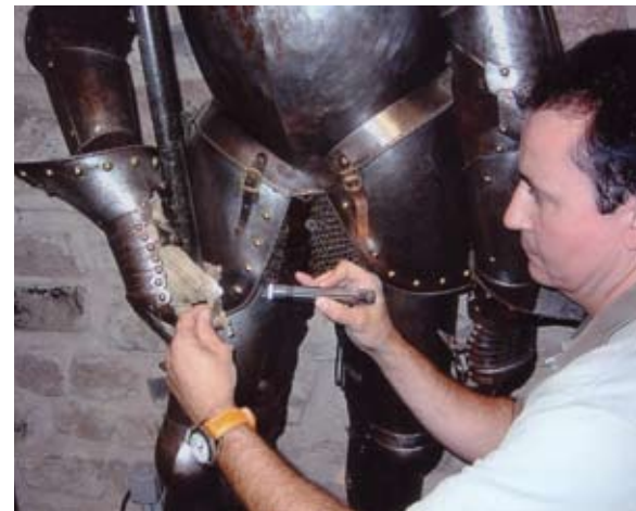
Inspección armadura.