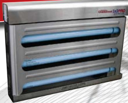
Chameleon® 1x3 PRO DISCRETION