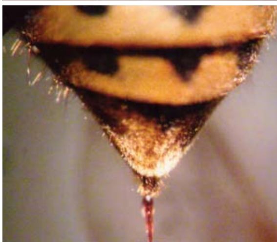
Detalle del aguijón de Vespula germanica .