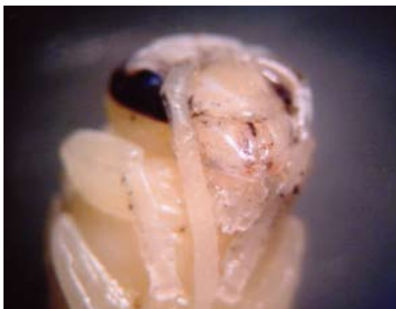
Detalle de una ninfa de Vespula germanica .