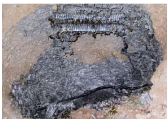
Detalle del nido.